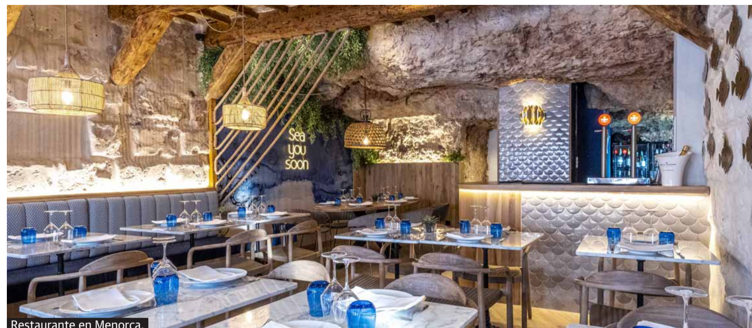
Restaurante en Menorca.

Uno de los puntos fuertes, elemento diferenciador en muchos casos de este estudio de interiorismo, es la empatía que mantienen con cada cliente y la capacidad que tienen sus profesionales de asesoramiento integral: «Muchos clientes cuentan con nosotros para saber si el local que van a adquirir es interesante o no, incluso si el negocio está bien enfocado o no. Nos converti-