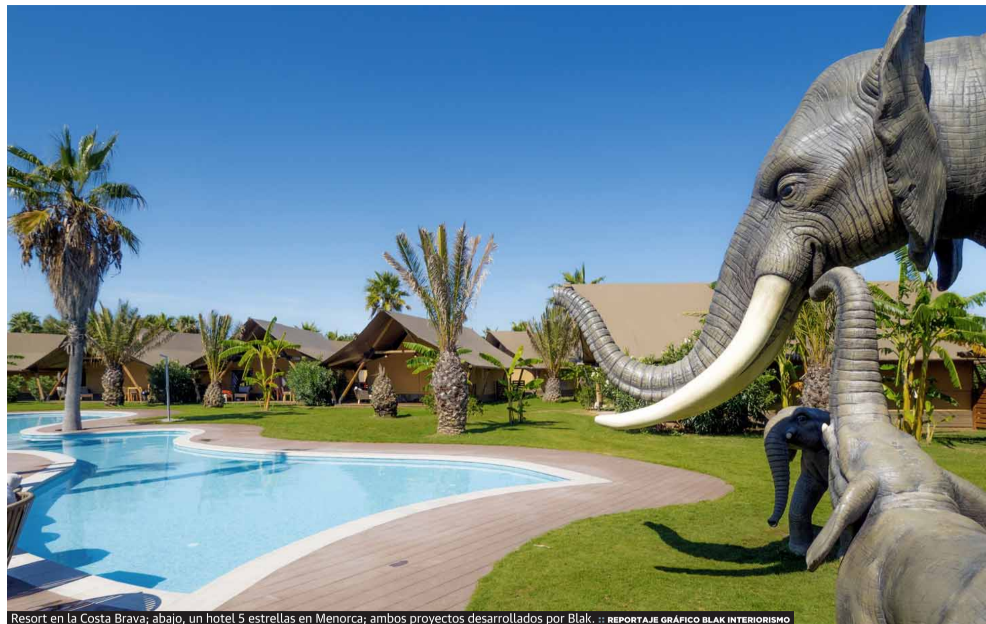
Resort en la Costa Brava; abajo, un hotel 5 estrellas en Menorca; ambos proyectos desarrollados por Blak.