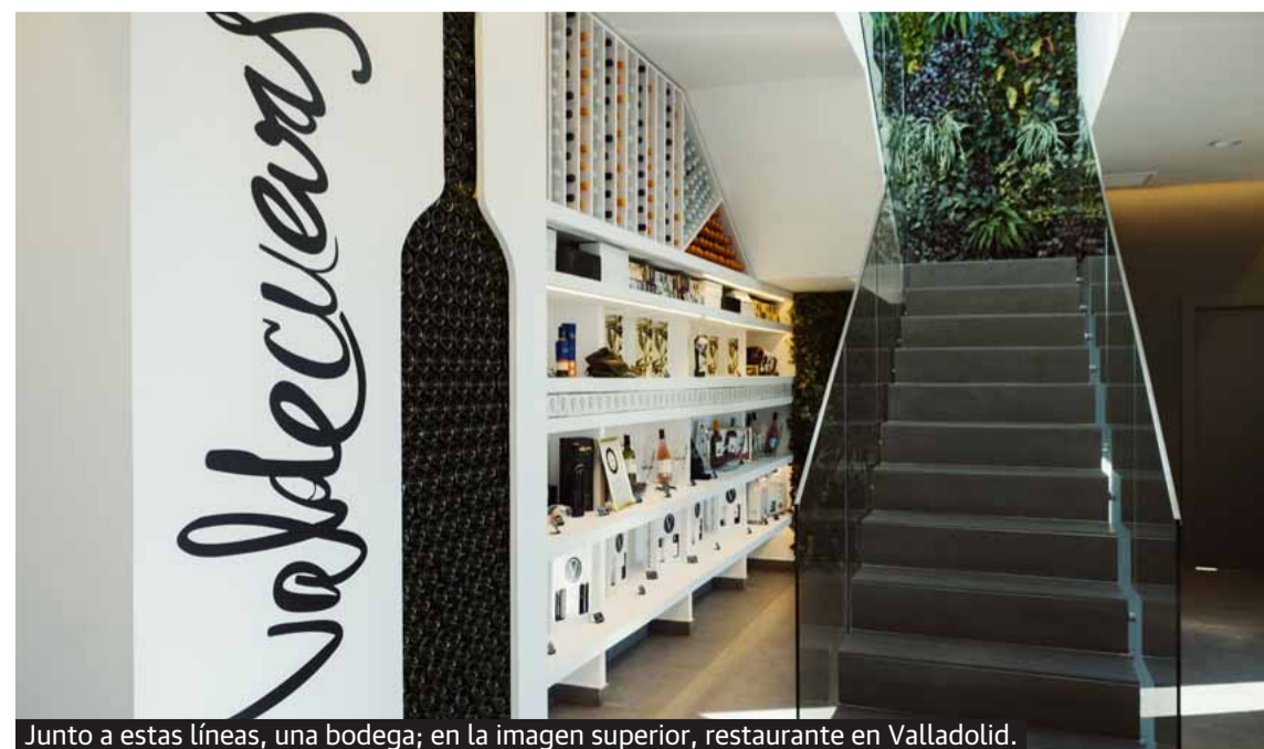
Junto a estas líneas, una bodega; en la imagen superior, restaurante en Valladolid.